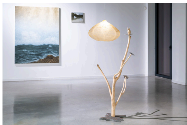
Exposition PNEUMA, Galerie Net Plus, © Stéphane Mahé