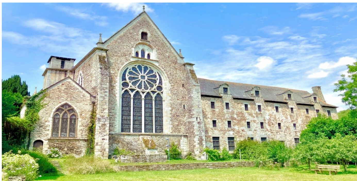
Abbaye Saint-Magloire de Léhon, vue jardin Est

Une disponibilité est impérative pour le temps de la résidence (Avril à Juin 2025). La présence de l'artiste est requise minimum 3 jours par semaine. Un calendrier sera fixé conjointement dans la convention de résidence.